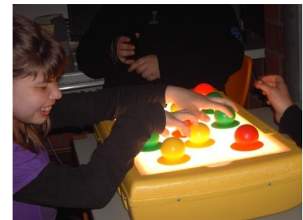
Förderung an der Lightbox